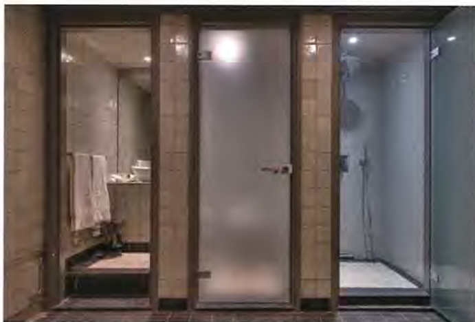
Veel aandacht is besteed aan 'de natte cel'. Toilet en douches zijn altijd gescheiden. De regendouche is comfortabel.