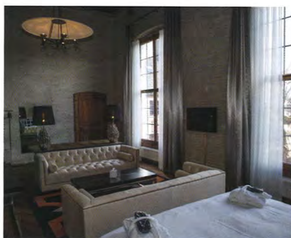
Iedere kamer is uniek ingericht. Deze suite maakt ook een verblijf van meerdere dagen comfortabel.